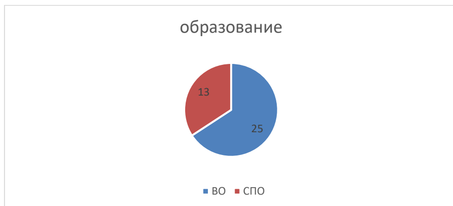
Диаграмма "Образование" показывает, что 63 % учителей имеет высшее образование, 37 % имеют среднее специальное образование.

25 педагогов с высшим образованием, 13 – со средним профессиональным. Соотношение представлено в процентном отношении.